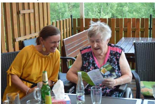
S dobrovolníky v restauraci