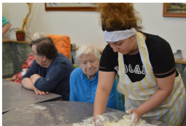
Pečení s děvčaty z VÚ VM